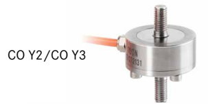
CO Y2/CO Y3